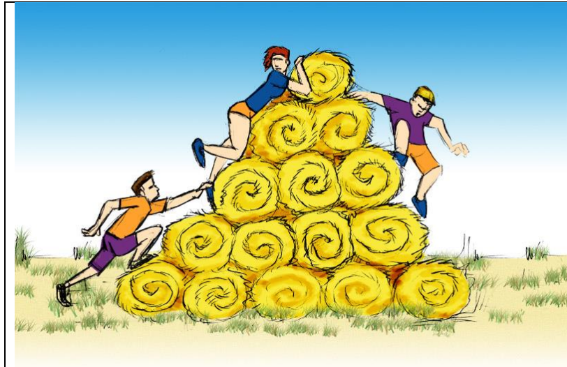
Hindernis „Mount Everstroh“