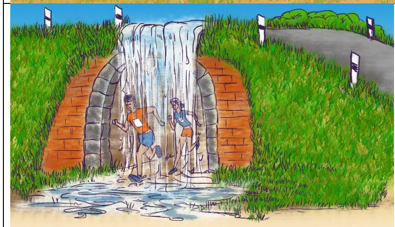
Hindernis „Rabenauer Fälle“